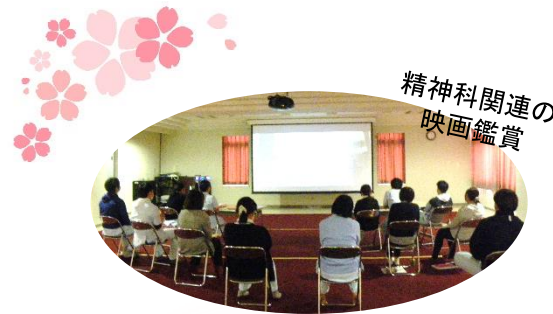
精神科関連の 映画鑑賞

4日間の研修を終えて、今回参加された中途採用者の方から「いままで勤務した職場ではこのような形での新人オリエンテーションをしたことはなかったため、院内の各部署の役割等々詳しく聴けてよかった」と嬉しい感想が返ってきました。これから責善会の新しいメンバーをみなさん、よろしくお願いたします。