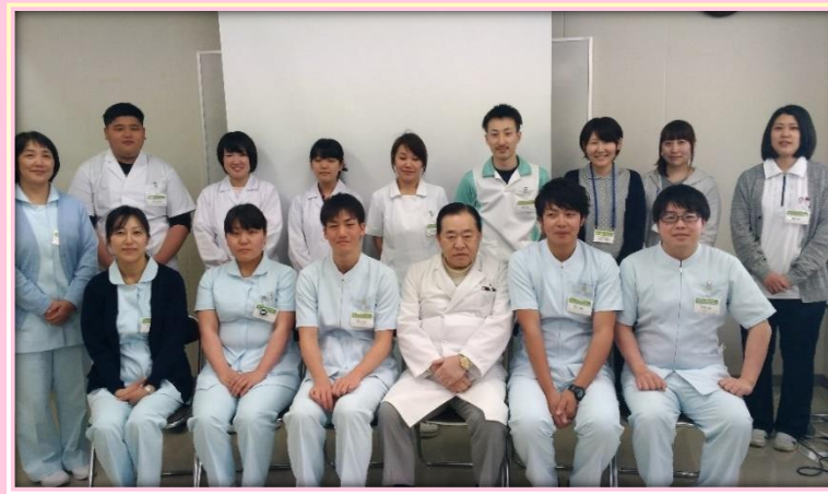
理事長先生を囲んで集合写真

4月2日に医療法人責善会平成30年度新入職員オリエンテーションが開催されました。当日は春らしい気候にも恵まれ、新規採用者と中途採用者を合わせて13名の方々を迎えることが出来ました。この日から4日間、ビジネスマナーをはじめ、精神科看護や医療安全・各部署の紹介等々の講義、各施設の見学が行われました。医療法人責善会の一員として、新たな第一歩を踏み出しました。それぞれ配属された部署で知識と経験を積み、活躍してもらいたいと思います。