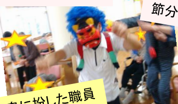
鬼に扮した職員 逃げるのに必死です!!