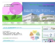
ホームページQRコード→