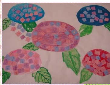
認知症棟「あじさい」の貼り絵