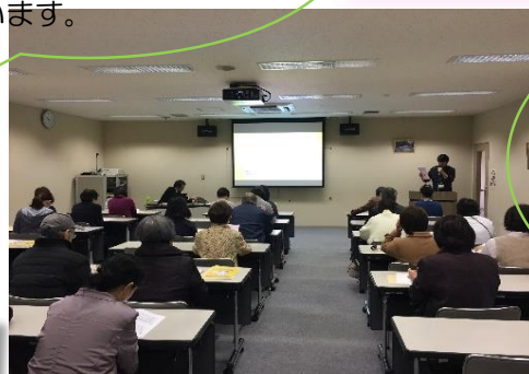
その他、たくさんのご感想を頂き、ありがとうございました。

誰もが抱えているストレス、精神に病気をもつ方たちを傍でいかに支えるかが問題。心理療法の基本ルールを知り、これから役に立てたいです。