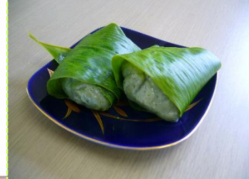
作業療法 調理実習「笹もち」